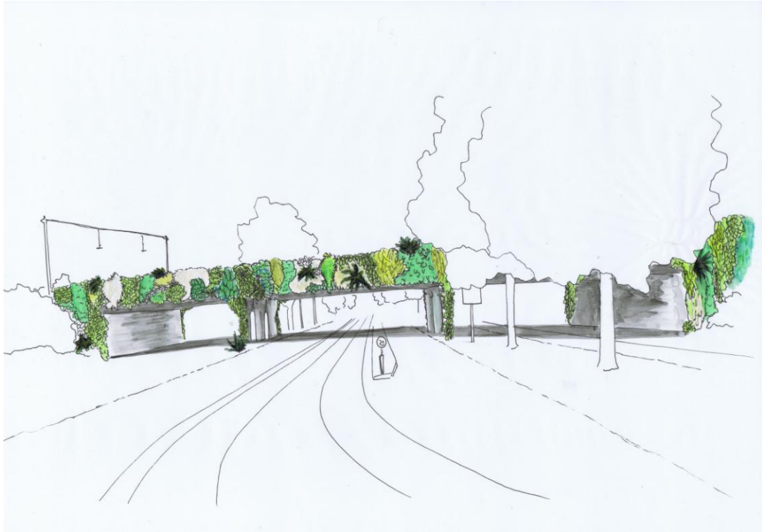
Impressie groene entree